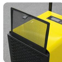
Elemento filtrante lavable