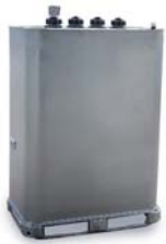
Depósitos de Combustible